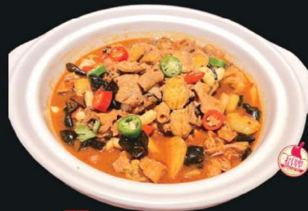
102A 奇味鸡煲 RM 68 /份 Umami Chicken Pot