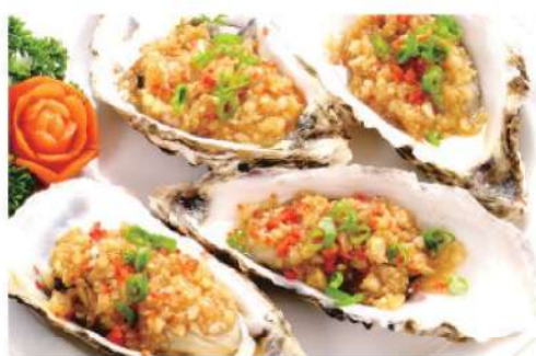
920A 生蚝 (1个) RM 25 /份 Oyster BBQ (1pc)