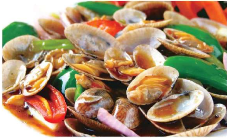
205B 姜葱花甲 RM 48 /份 Stir fried Clamp with Ginger Onion