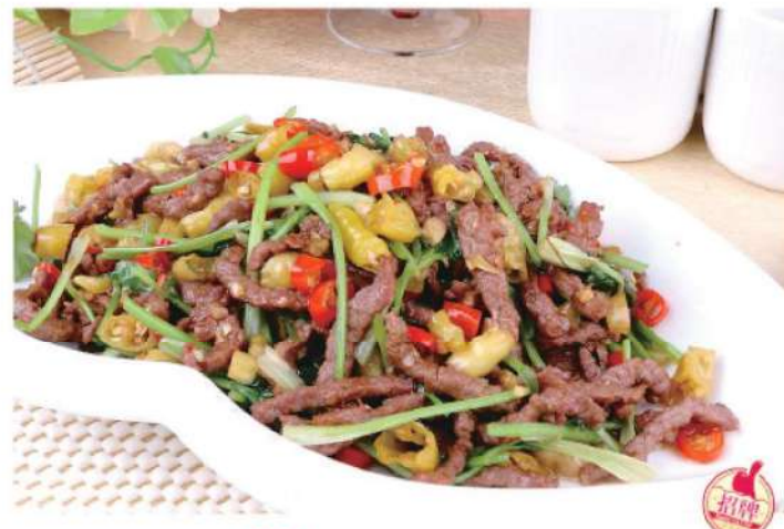
503A 野山椒牛肉丝 RM 46 /份 Mountain Chilly Stirfried Beef

本菜谱图片仅供参考，出品以实物为准！ The pictures of the menu are only for your reference, to prevail in kind!