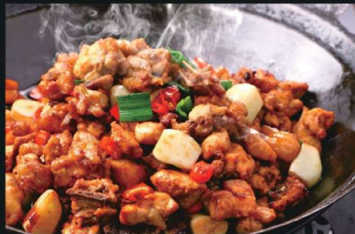
104A 干锅鸡 RM 38 /份 Griddle Chicken

本菜谱图片仅供参考，出品以实物为准！ The pictures of the menu are only for your reference, To prevail in kind!