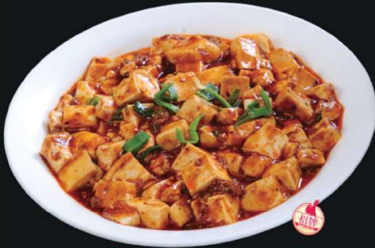
602A 麻婆豆腐 RM 22 /份 MaPo Tofu