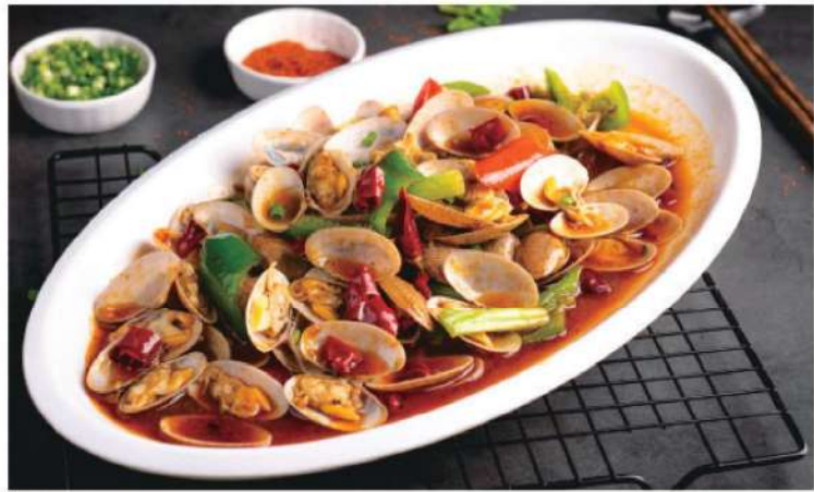
205A 特色花甲 RM 48 /份 Sichuan Clam

尝百味，譬乃为无味。若如此，何以辨生无味是死？不然，盖人生千世，譬凡尘，幸甚人，能以知天下事于流俗一生，不能不悟于百味所感。亦不可知于不试，然则试亦应择量择贵而行之，辨何量，辨何贵？此吾人喜异矣。智者尝百味过后，方知味之至也至正幸身健，乃为无味；愚者百味过后，只知其所爱之味为至纯之正，于是终其一生尝无味之憾至。