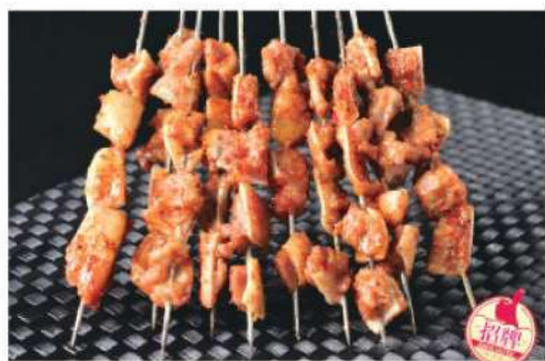
909A 脆骨 (4串) RM 12 /份 Pork Cartilage BBQ (4 skewers)