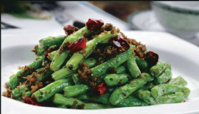
606A 干煸四季豆 RM 28 /份 Stirfried Four Seasoned Bean