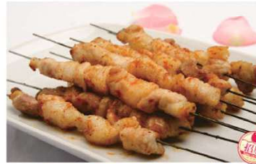
903A 猪肉串 (4串) Pork BBQ (4 skewers) RM 10 /份