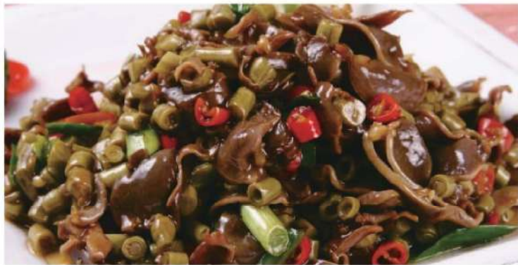
110A 酸豆角鸡杂 RM 38 /份 Pickled Long Bean Chicken Gizzard