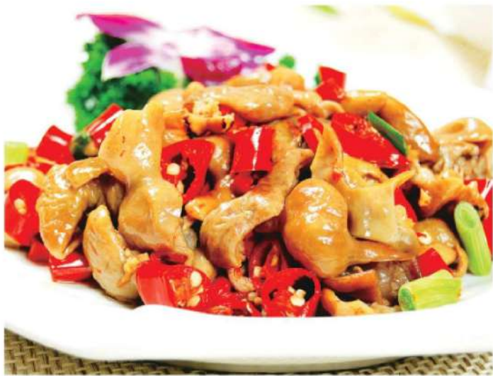
307A 泡椒肥肠 RM 48 /份 PaoJiao Pork Colon

本菜谱图片仅供参考，出品以实物为准！ The pictures of the menu are only for your reference, to prevail in kind!