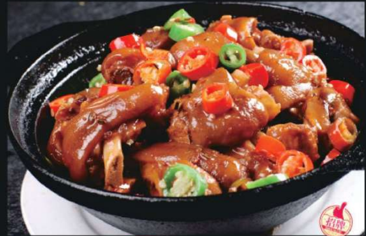
320A 砂锅猪蹄 RM 58 /份 Clay Pot Pork Leg