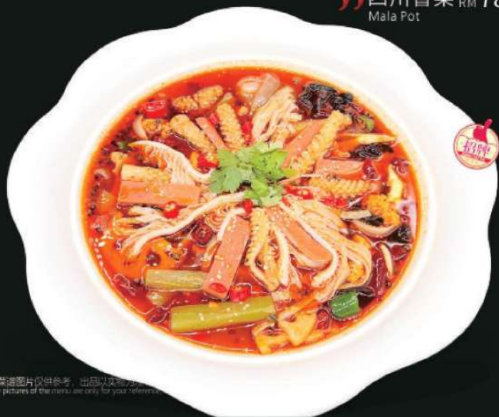
632A 四川冒菜 RM 78 /份 Mala Pot

Not just [the world Xin] dishes feature, it is [the world Xin] gluttonous eaters of honor and commitment