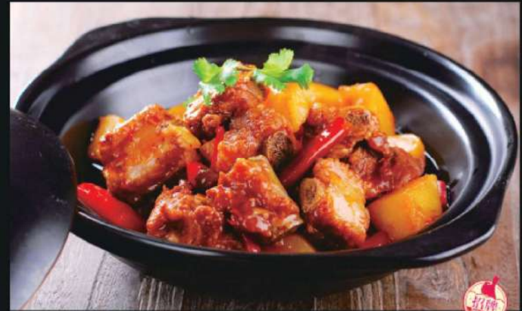
324A 砂锅排骨 RM 58 /份 Clay Pot Pork Rib

有人说餐饮之道好比禅，靠的全是个人的参悟，比如说大厨们将全世界的所有食用原料，烹饪方法拆分排列，再重新组合。若然不是割心一处，思虑观修，群的智慧，那如何成菜？如何成就