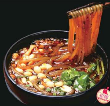
806S 酸辣粉(小) RM 15 /份 Spicy & Sour Noodle