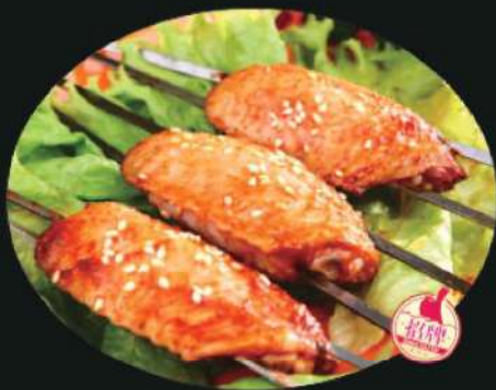
911A 鸡中翅 (1个) Chicken Wing Center BBQ (1pc) RM 6 /份