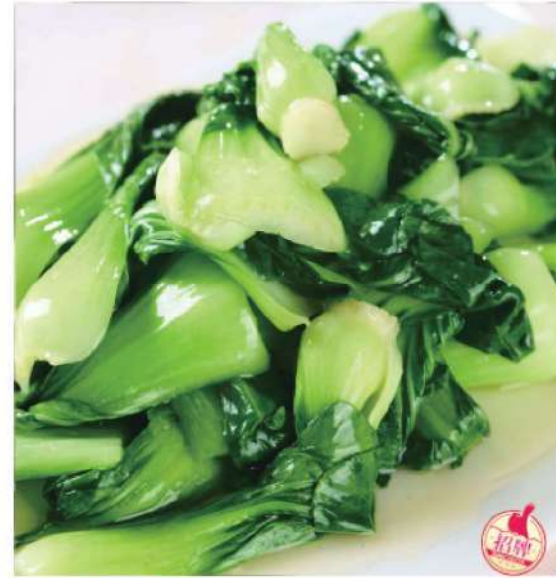
623A 清炒上海青 RM 22 /份 Stirfried Shanghai Green Vege

特色 TESETUIJIAN TASTE THE DIFFERENCE TESETUIJIAN TASTE THE DIFFERENCE