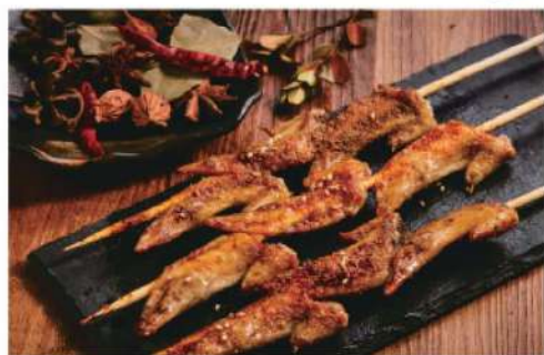
914A 鸡尖 (4串) RM 8 /份 Chicken Wing Tips BBQ (4 skewers)