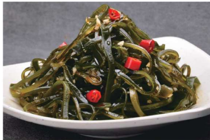
611A 凉拌海带 RM 18 /份 Pickled Spicy Seaweed

本菜谱图片仅供参考，出品以实物为准！ The pictures of the menu are only for your reference, to prevail in kind!