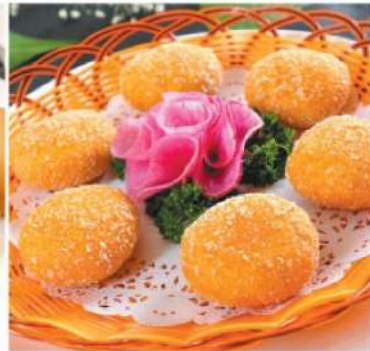
802S 南瓜饼(8粒) RM 18 /份 Melon Pancake (8 pcs)