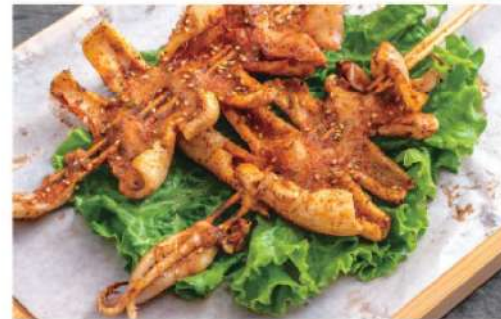
907A 鱿鱼 (1条) Calamari BBQ (1pc) RM 16 /份

本菜谱图片仅供参考，出品以实物为准！ The pictures of the menu are only for your reference, to prevail in kind!