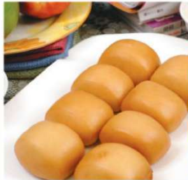
803S 黄金馒头(8粒) RM 16 /份 Golden ManTow (8pcs)

有人说餐饮之道好比棋，靠的全是个人的参悟，比如说大厨们将全世界的所有 的食用原料、烹饪方法重新排列，再重新组合。 若然不是制心一处，思维观修，斟酌冥想，那如何成菜？ 如何成就。