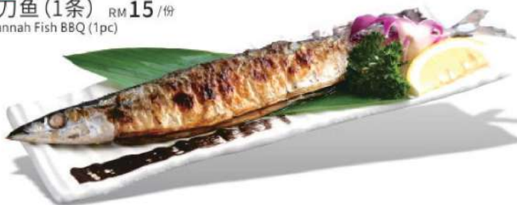
905A 秋刀鱼 (1条) RM 15 /份 Savannah Fish BBQ (1pc)