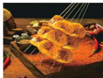
929A 土豆片 (4串) RM 10 /份 Sliced Potato BBQ (4 skewers)

一菜一味，一盘一韵， 承载着中华饮食文化的经典，绽放着长江黄河的风情， 悠然回味，沉醉在清香的美食间。