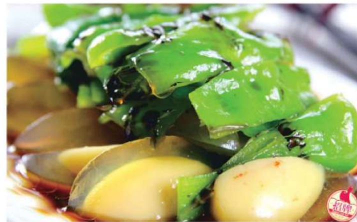
610A 青椒皮蛋 RM 20 /份 MaLa Green Pepper Century Egg

On the diet, Chinese people have their own characteristics, which is feeding system. Feeding system of the Source early, visible from many people digging underground cultured milk, moisture and feeding place for cooking to unified, cook in the middle of the house, have a slight on the smoke, fire, under the fire for cooking on the fire, Professor around feeding fire. This feeding the ancient customs, we said later. Feeding system of circulating for a long time, China attaches great importance to the blood relatives and family is family values reflect in the diet. To the present Day, the Chinese meaning reunion is a reflection of the idea.