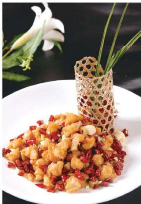
106L 辣子掌中宝 (大) RM 88 /份 LaZi Chicken Cartilage (L)