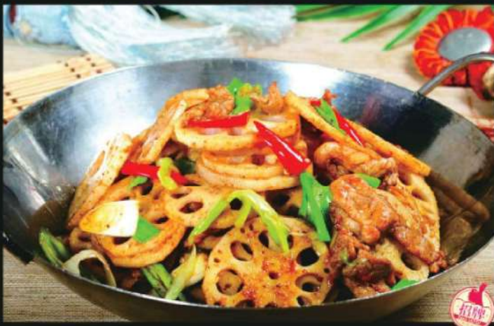
605A 干锅藕片 RM 42 /份 Griddle Lotus Shoot

善食性者，先泻而饮，饮食不过多，多笋气，泻则伤血； 先而食，食不过饱，饱则伤神，则伤胃