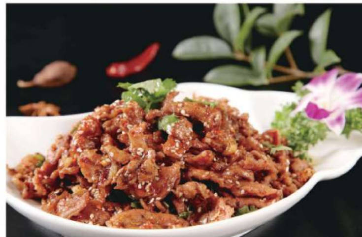
502A 孜然羊肉 RM 46 /份 Zi Ran Stirfried Lamb

On the 5th, Chinese people have their own characteristics, which is feeding system. Feeding system of the Source early, visible from many people digging underground cultural relics, ancient and feeding place for cooking is justified, cook in the middle of the house, have a slight on the smoke. fire under the do for cooking on the fire. Produce around feeding fire. This feeding the ancient customs, one word later. Feeding system of circulating for a long time, China attaches great importance to the blood relatives and family is family values reflect in the diet. To the present Day, the Chinese staying reunion is a reflection of the idea.