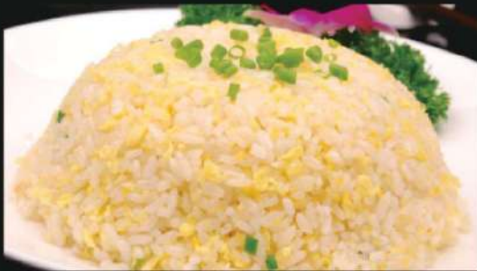
810A 蛋炒饭 Egg Fried Rice RM 16 /份