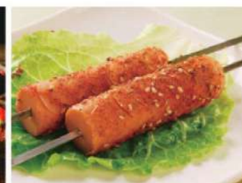
922A 火腿肠 (1条) RM 5 /份 Pork Sausage BBQ (1pc)