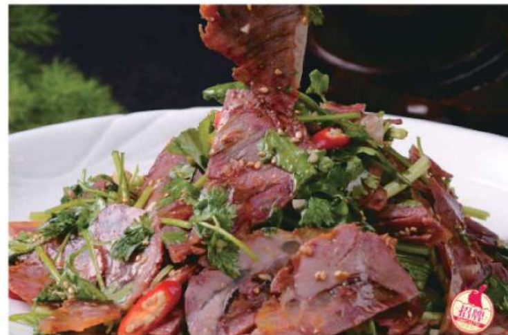
505A 麻辣牛肉 RM 28 /份 MaLa Sliced Beef