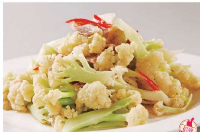
631C 清炒松花菜 Stirfried Pine Cauliflower RM 28 /份