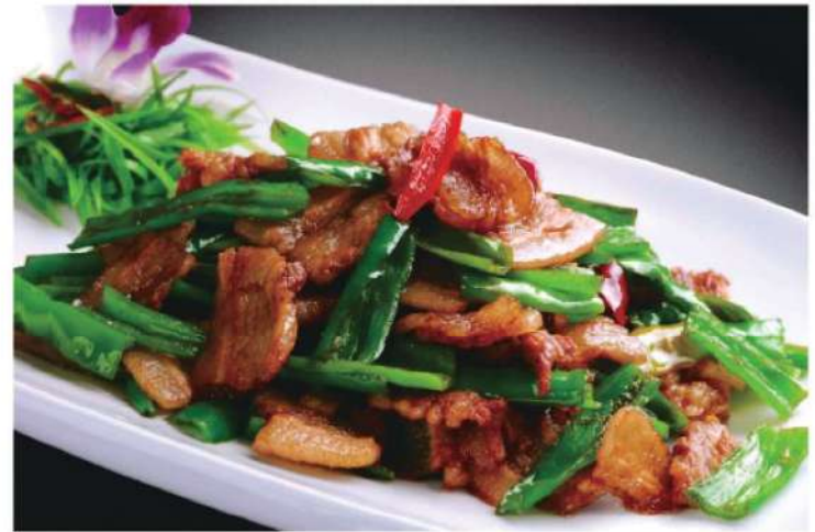
302A 农家小炒肉 RM 38 /份 Farmhouse Stirfried Pork

本菜谱图片仅供参考，出品以实物为准！ The pictures of the menu are only for your reference, to prevail in kind!