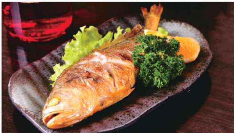
906A 小黄鱼 (1条) RM 12 /份 Yellow Croaker Fish BBQ (1pc)