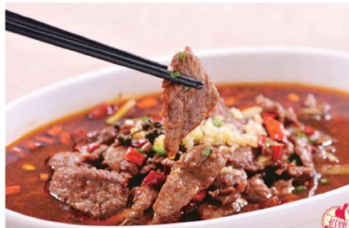
501A 水煮牛肉 RM 56 /份 ShuiZhu Beef