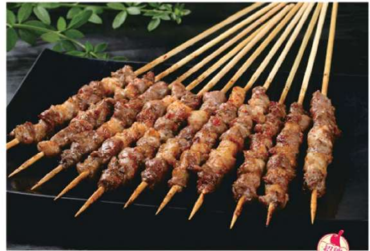
904A 羊肉串 (4串) Lamb BBQ (4 skewers) RM 15 /份

本菜谱图片仅供参考，出品以实物为准！ The pictures of the menu are only for your reference, to prevail in kind!