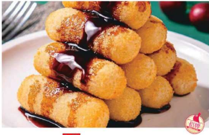
815S 红糖糍粑8粒 RM 18 /份 Brown sugar glutinous rice(8pcs)