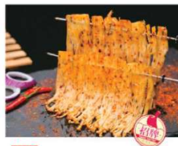
926B 孜然金针菇 (1盘) RM 6 /份 Enoki Mushroom BBQ (1 dish)

本菜谱图片仅供参考，出品以实物为准！ The pictures of the menu are only for your reference, to prevail in kind!