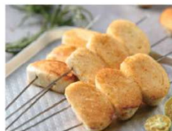
919A 馒头 (4串) RM 10 /份 Man Tou BBQ (4 skewers)