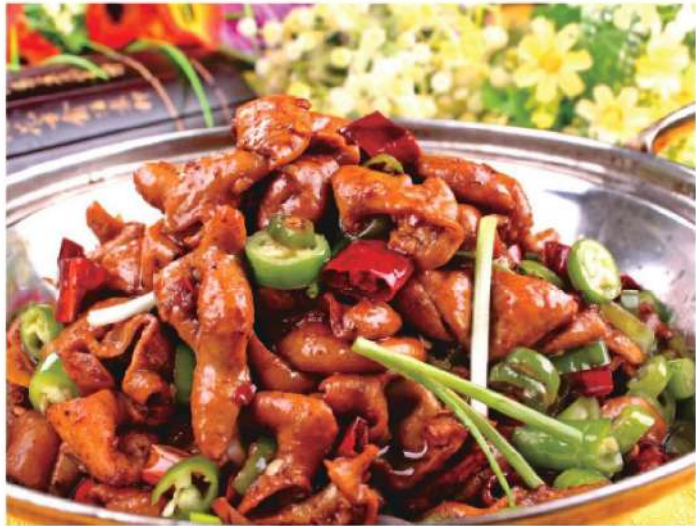
308A 干锅肥肠 RM 48 /份 Griddle Pork Colon