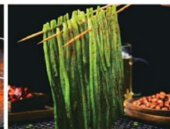
925A 韭菜 (1盘) RM 6 /份 Chives BBQ (1pc)

一菜一味，一盘一韵， 承载着中华饮食文化的经典，绽放着长江黄河的风情， 悠然回味，沉醉在清香的美食间。