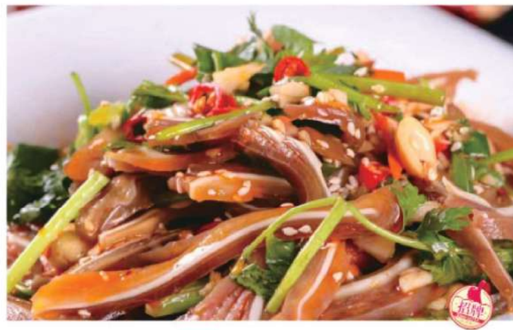
312A 红油猪耳 RM 22 /份 MaLa Pork Ear