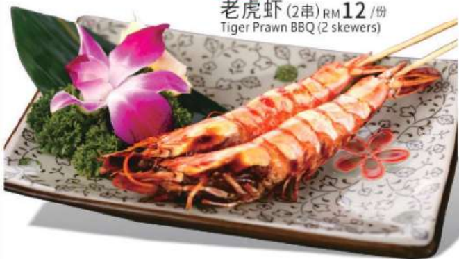
928A 老虎虾 (2串) RM 12 /份 Tiger Prawn BBQ (2 skewers)