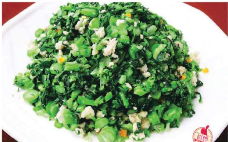
327A 雪里红肉沫 RM 28 /份 Sichuan Vegetable With Minced Pork