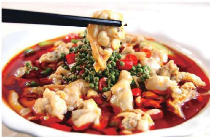
403A 水煮田鸡 RM 58 /份 ShuiZhu Pork