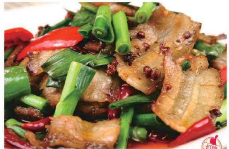
301A 回锅肉 RM 48 /份 Sichuan Stirfried Pork

· 宗旨：传承粤菜精髓 · 理念：健康美味 · 特色：粤菜大师主理 · 品牌：招牌菜