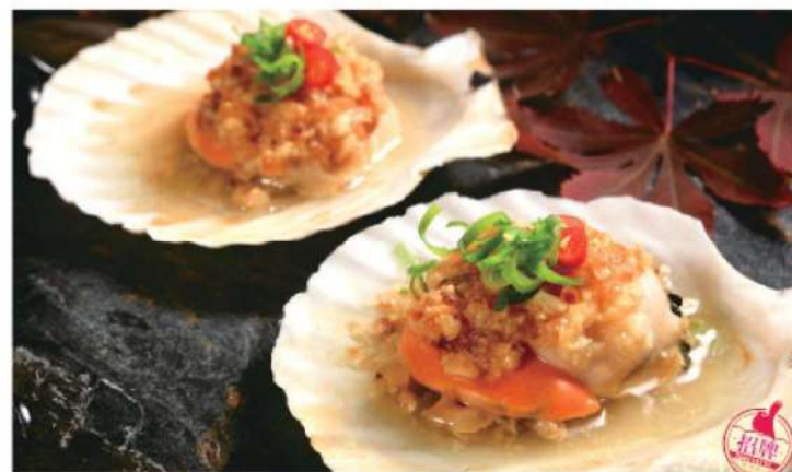
917A 扇贝 (2个) RM 20 /份 Scallop BBQ (2pcs)