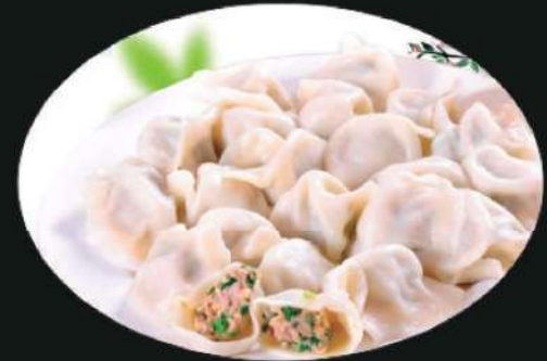
804S 水饺(8粒) Dumpling (8pcs) RM 16 /份