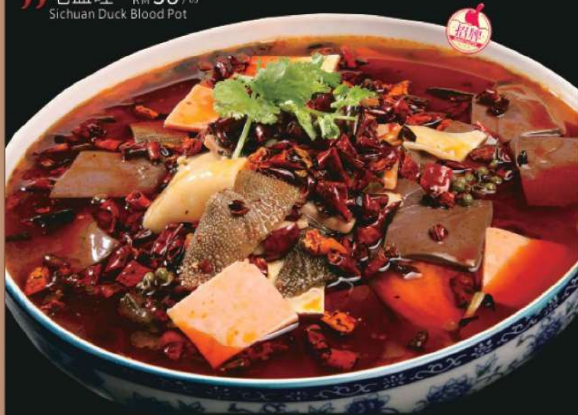
504A 毛血旺 RM 58 /份 Sichuan Duck Blood Pot