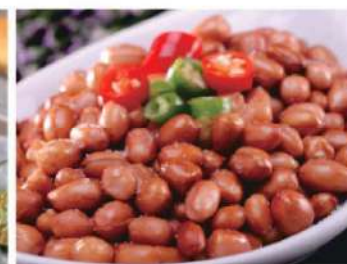
A01A 小吃花生米 RM 12 /份 Peanut