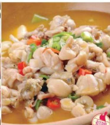
402A 金汤馋嘴蛙 RM 58 /份 JinTang Pork

本菜谱图片仅供参考，出品以实物为准！ The pictures of the menu are only for your reference, to prevail in kind!