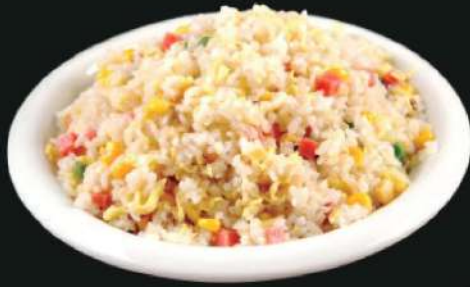
812A 扬州炒饭 Yang Zhou Fried Rice RM 24 /份