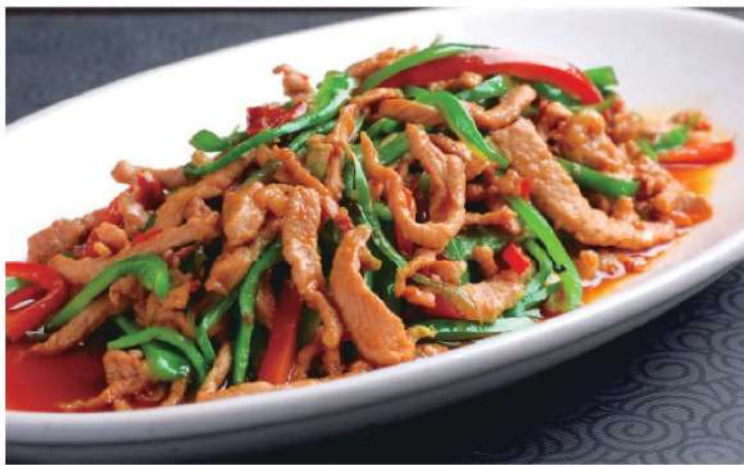
329B 青椒炒肉丝 RM 36 /份 Stirfried Green Pepper Shredded Pork

精。是对中华饮食文化的内在品质的概括。孔子说过：“食不厌精，脍不厌细”。这反映了先民对于饮食的精品意识。当然，这可能仅仅局限于某些贵族阶层。但是，这种精品意识作为一种文化精神，却越来越广泛、越来越深入地渗透、贯彻到整个饮食活动过程中。选料、烹调、配伍乃至饮食环境，都体现着一个“精”字。