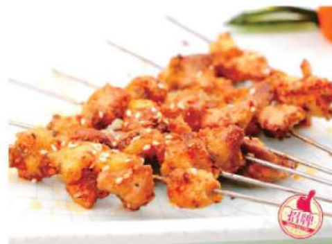
931A 掌中宝 (4串) Chicken Cartilage BBQ (4 skewers) RM 15 /份