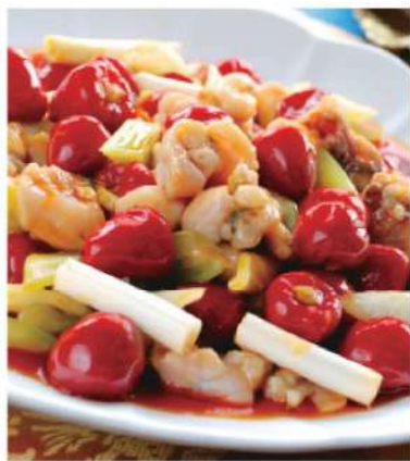
404A 泡椒田鸡 RM 58 /份 PaoJiao Pork