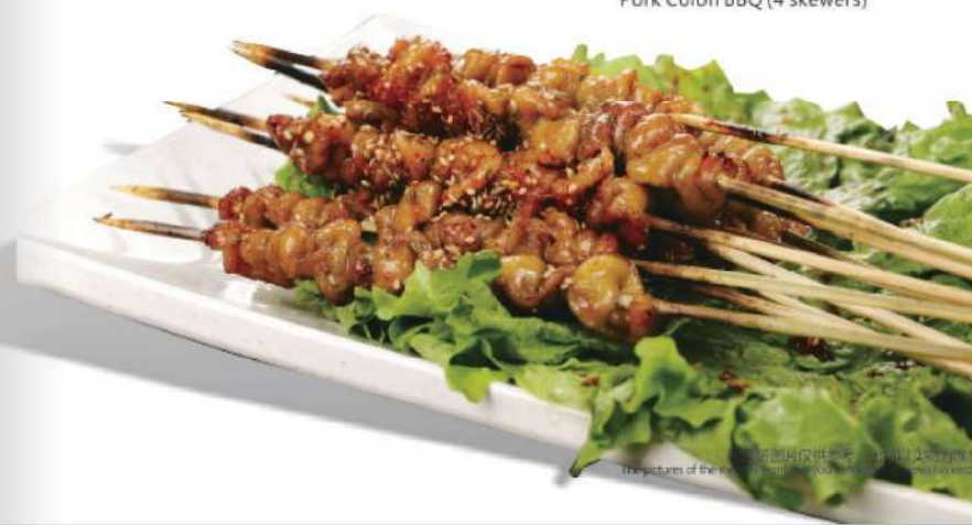
918A 烤肥肠 (4串) RM 15 /份 Pork Colon BBQ (4 skewers)

本菜图片仅供参考，出品以实物为准！ The pictures of the menu are only for your reference. To prevail in kind!