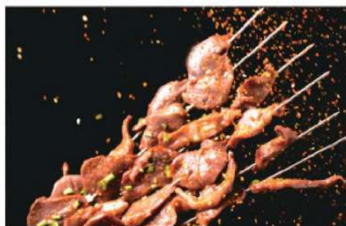
913A 鸭胗 (4串) RM 10 /份 Duck Gizzard BBQ (4 skewers)

本菜谱图片仅供参考，出品以实物为准！ The pictures of the menu are only for your reference, to prevail in kind!