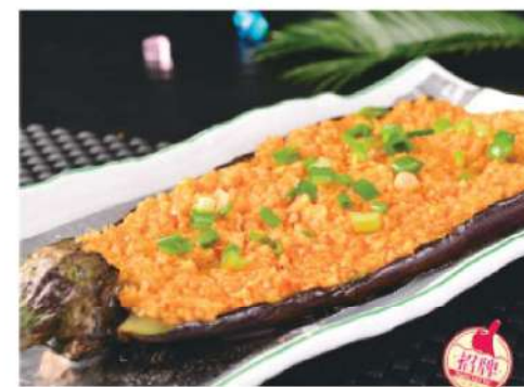
930A 茄子 Eggplant BBQ (1pc) RM 15 /1个