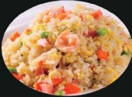
801A 米饭 Rice RM 2.8 /份 811A 虾仁炒饭 Shrimp Fried Rice RM 26 /份