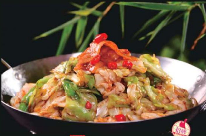
601A 干锅手撕包菜 RM 28 /份 Griddle Cabbage