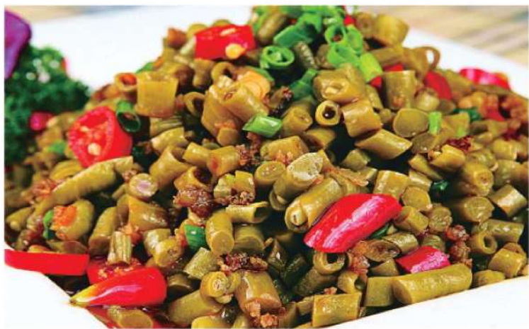
328A 酸豆角肉沫 RM 36 /份 Pickled Long Bean with minced meat

我国烹饪史的历史可追溯到商代。《史记·礼书世家》中有“始始有象箸”的记载。对为商代末期君主，以此推算，我国至少有三千多年的烹饪历史了。先秦时期称筷子为“挟”，秦汉时期叫“箸”。古人十分讲究忌讳，因“箸”与“住”字谐音，“住”有停止之意，乃不吉利之语，所以就反其意而称之为“筷”。这就是筷子名称的由来。