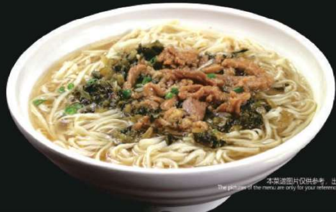
809L 阳春面(大) RM 28 /份 Longevity Noodle (L)