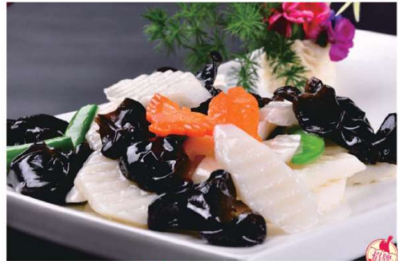
634A 山药木耳 RM 29 /份 Chinese Yam Baby Fungus

特色 TESETUIJIAN TASTE THE DIFFERENCE TESETUIJIAN TASTE THE DIFFERENCE