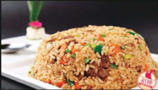
813A 牛肉炒饭 Beef Fried Rice RM 28 /份

本菜谱图片仅供参考，出品以实物为准！ The pictures of the menu are only for your reference, to prevail in kind!